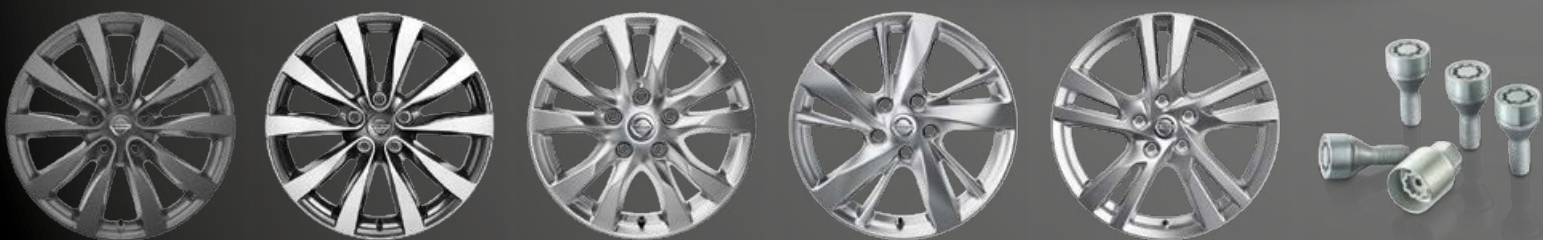
18" легкосплавные диски RAY 1 , темно-серые (06) 18" легкосплавные диски RAY 1 , темно-серые, полированные (09) 16" OE легкосплавные диски, серебристые (01) 17" OE легкосплавные диски, серебристые (02) 18" OE легкосплавные диски, серебристые (03)